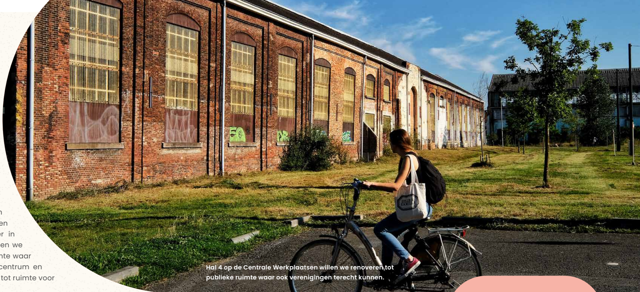
Hal 4 op de Centrale Werkplaatsen willen we renoveren tot publieke ruimte waar ook verenigingen terecht kunnen.

In zomerse temperaturen is een duik in openlucht-zwembad heerlijk. In Leuven kan dat enkel in het ploeterbad van het provinciedomein, en daar willen we verandering in brengen. We ijveren ervoor dat de provincie een volwaardige zwembad aanlegt in het provinciaal domein, waar je echt kan zwemmen.