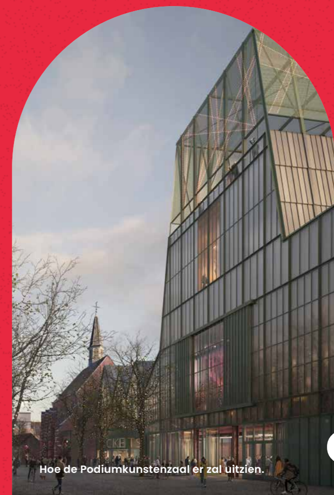
Hoe de Podiumkunstenzaal er zal uitzien.